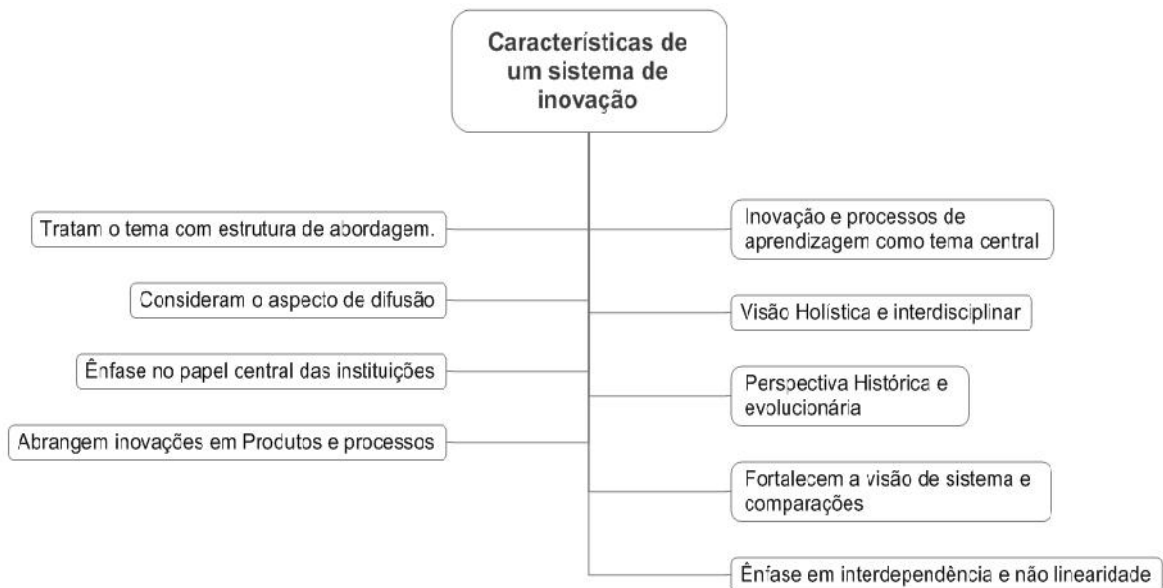
Figura 2: características em abordagens de sistema de inovação. Fonte: Elaborado a partir de Edquist (2004)

Edquist (2004), em suas análises sobre sistemas de inovação, aponta nove características comuns nas abordagens, conforme apresentadas na Figura 2.