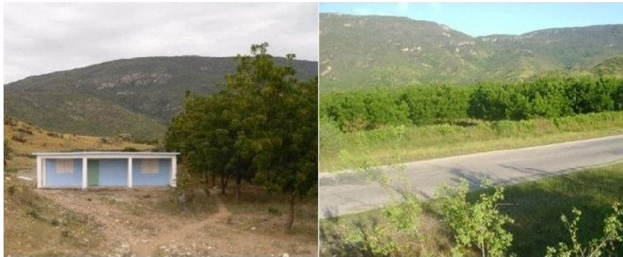
Imagen 1. Agro-industrialización de cultivo del Neem

A partir de una zona fuertemente degradada, abandonada por la Agricultura, se comenzaron acciones de reforestación con el Árbol del Neem habida cuenta de su capacidad para resistir el Stress hídrico. Se plantaron 37 hectáreas del cultivo y se prevé extenderlo hasta 200. La recuperación del ecosistema es perceptible en siete años de plantada. Se construyó una minindustria para la extracción del aceite de su fruto, ampliamente conocido por sus excelentes propiedades como bioplaguicida y también en la industria de medicamentos. Decenas de familias han encontrado allí una forma decorosa de empleo en el manejo de las plantaciones y en labores silvopastoriles.