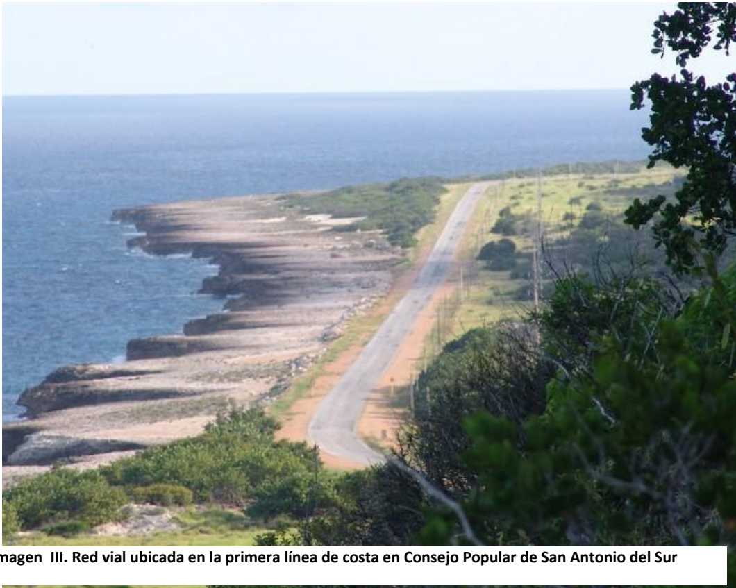
Imagen III. Red vial ubicada en la primera línea de costa en Consejo Popular de San Antonio del Sur

los mismos garantizan la funcionabilidad de sistemas como los de salud, comunicaciones el suministro de alimentación y agua potable a la población. Para este factor en franja costera de San Antonio del Sur la disponibilidad eléctrica mediante grupos electrógenos está al 100%.